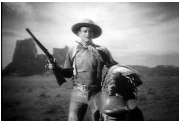
John Ford. Rio Grande , 1950.

Pla americà: és el que talla la figura humana sota els genolls, permet captar aspectes de l'expressivitat dels personatges en un context global.