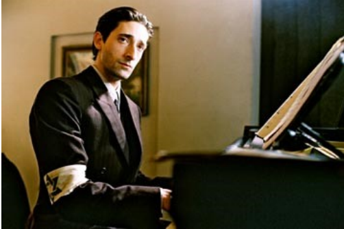
Roman Polanski. El pianista, 2002.

Pla mitjà: talla la figura per la cintura o a l'alçada del pit. Intensifica el valor expressiu dels rostres i de les mans i permet la presència de fins a dos personatges.