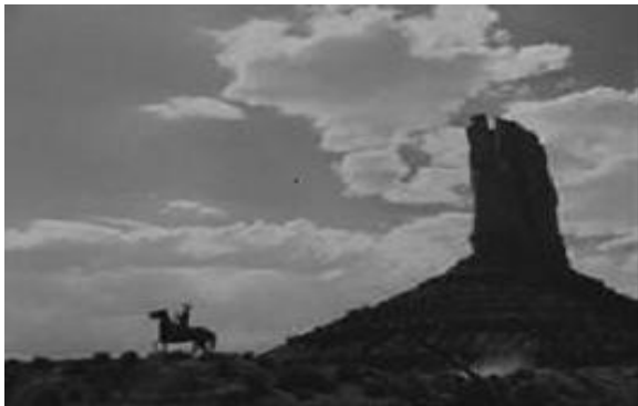
John Ford. Rio Grande , 1950.

Pla general: insereix el referent en un context espacial. El seu ús dramàtic està reservat a les escenes de grup o a la relació d'un personatge amb el context que l'envolta.