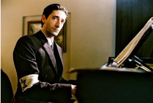
Roman Polanski. El pianista, 2002.

Pla mitjà: talla la figura per la cintura o a l'alçada del pit. Intensifica el valor expressiu dels rostres i de les mans i permet la presència de fins a dos personatges.