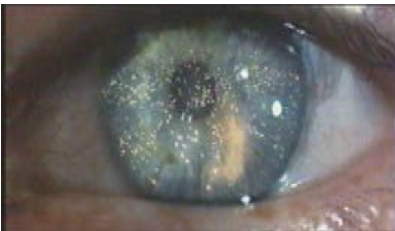
Ridley Scott. Blade Runner, 1988.

Pla detall: Subratlla una part del rostre o la presència d'un petit objecte amb alguna significació dramàtica, narrativa o simbòlica.