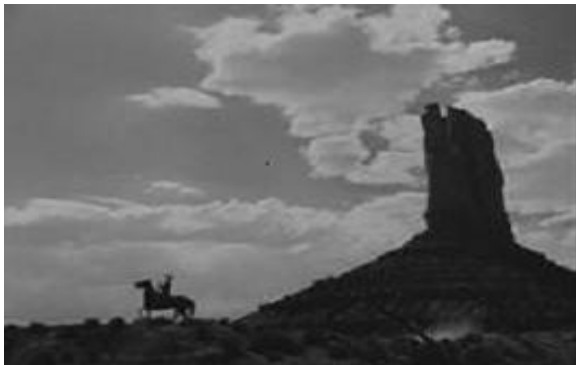
John Ford. Rio Grande , 1950.

Pla general: insereix el referent en un context espacial. El seu ús dramàtic està reservat a les escenes de grup o a la relació d'un personatge amb el context que l'envolta.