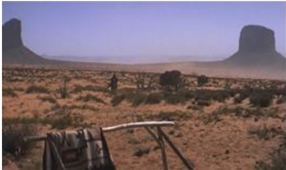
John Ford. Centauros del desierto , 1956.

Gran pla general: té un valor dramàtic eminentment descriptiu i ressalta la subordinació del referent al context que l'envolta.